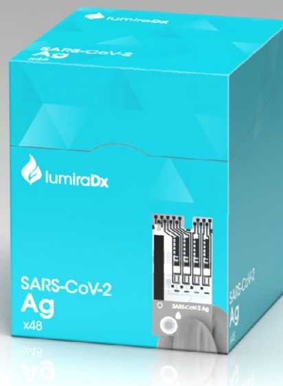
Eine Packungseinheit Antigen Teststreifen (48 Stück)