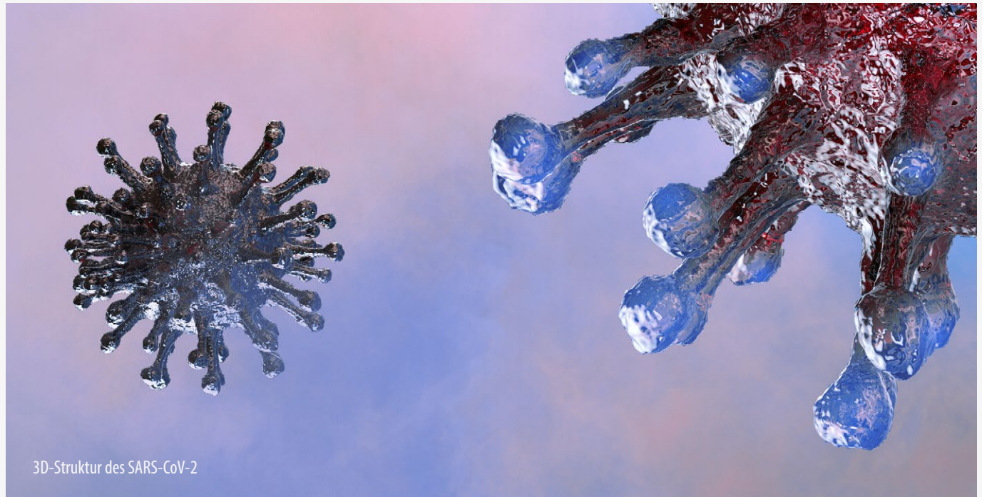
3D-Struktur des SARS-CoV-2

Der Test basiert auf einem Mikrofluidik-Immunfluoreszenztest für den direkten und qualitativen Nachweis des Nukleokapsid-Protein-Antigens aus dem Abstrichmaterial.